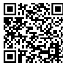
Art at Easter